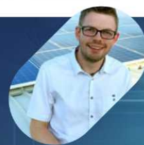
A cura di Marco Melucci